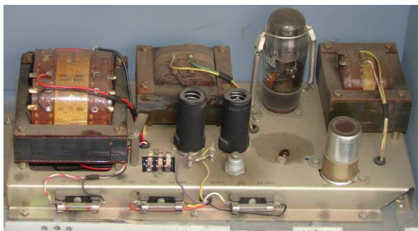
foto voedingsblok op vloerplaat