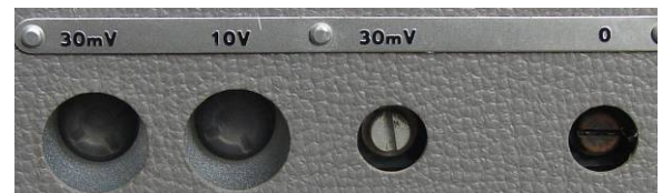
aansluitingen rechts 30mV en 10V 1000Hz