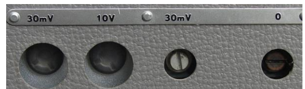
aansluitingen rechts 30mV en 10V 1000Hz