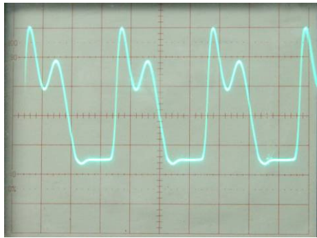
oscilloscoopbeeld 1MHz op 1µs/verd