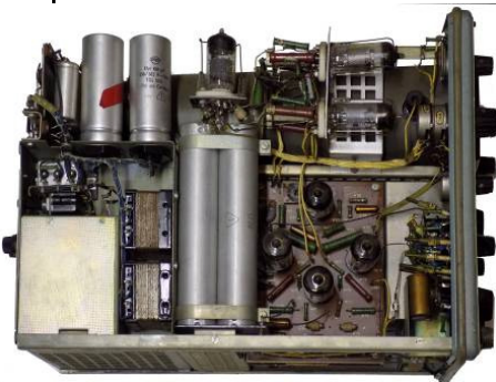
open zijzicht links