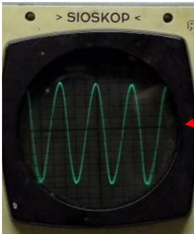
met signaal 100Hz