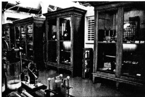
Zo kan het ook ...

Redactieadres: SIWE • Stapelhuisstraat 15 • 3000 Leuven • Tel. & fax: 016-58 43 42 E-mail: info@siwe.be • Website: www.siwe.be • Verschijnt tweemaandelijks Verantwoordelijke uitgever: André Montald • Mercatorpad 14/301 • 3000 Leuven