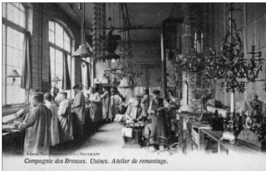
1900. Compagnie des Bronzes. Usines. Atelier de remontage.

voorbeeld doorheen de Brusselse kanaalzone. Hoogtepunt van het najaar wordt ongetwijfeld de tentoonstelling Fabrique d'Art over La Compagnie des Bronzes , ooit gevestigd in de huidige gebouwen van La Fonderie in Molenbeek. La Compagnie des Bronzes werd opgericht in 1854 en was gespecialiseerd in het vervaardigen van bronzen monumenten, kunstvoorwerpen, decoratie en lichtarmaturen. In de tweede helft van de negentiende eeuw verwierf de Compagnie wereldfaam met het gieten van bronzen monumenten, zowel in België (bijvoorbeeld Egmont en Hoorn, de Brabo-fontein) als in het buitenland (bijvoorbeeld het hek van de New Yorkse Zoo en het Lord Leighton -herdenkingsmonument in Engeland). Aan de basis van dat succes lag de technische superioriteit van het atelier, dat ook met de meest vooraanstaande beeldhou-