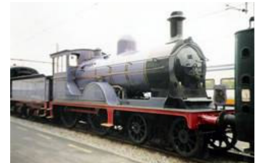
Belgische stoomlocomotief type 18

Op zoek naar informatie over spoorwegerfgoed ? Surf naar http://langsderails.nl/index2.html , een website over technisch erfgoed met nadruk op spoorwegmateriaal in de Benelux en in Duitsland.