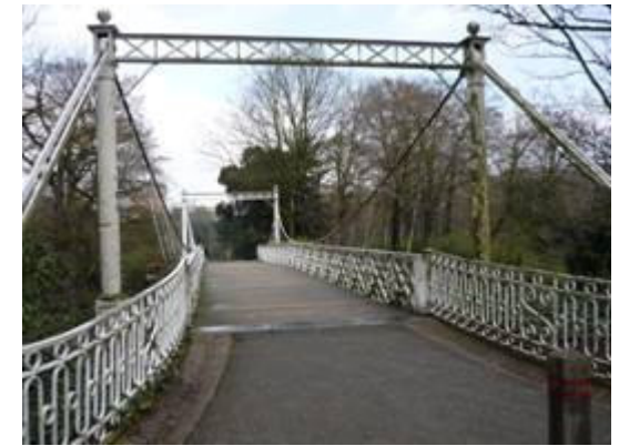
Stadspark Antwerpen Ijzeren hangbrug