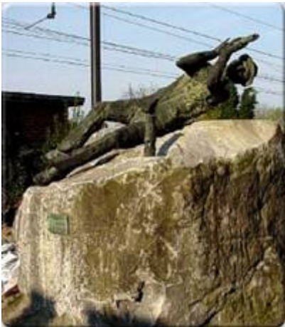
Beeld van De Mijnwerker

Wie in het begin van vorige eeuw niet kon leven van de opbrengst van de akkers, was verplicht om den brode in de grauwe mijnschachten neer te dalen om steenkool te ontginnen. Het station van Galmaarden was toen een draaischijf voor het pendelvervoer van alle mijnwerkers uit de streek van het Pajottenland naar de Borinage in Henegouwen. Het spoorwegstation van vroeger werd intussen afgebroken en omstreeks 2000 vervangen door een sober nieuw gebouw, waarin het bescheiden mijnwerkersmuseum is ondergebracht.