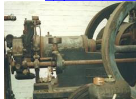
Foto gasmotor