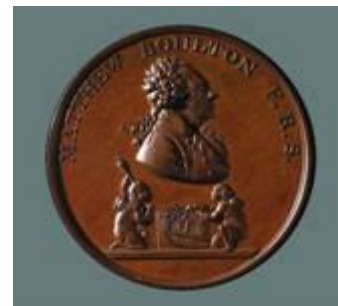
Medaille Matthew BOULTON

Tweehonderd jaar geleden stierf de Britse uitvinder en industrieel Matthew BOULTON (1728-1809). Zijn faam werd sinds het begin van de twintigste eeuw overschaduwd door zijn zakenpartner James WATT. Zonder BOULTON had WATT nooit bereikt wat hij gerealiseerd heeft. De viering van 200 jaar BOULTON kwam tot stand door een samenwerking tussen volgende instellingen: Birmingham Museum & Art Gallery, Birmingham City Archives, University of Birmingham, Birmingham City University, Aston University, Birmingham Assay Office & the Lunar Society.