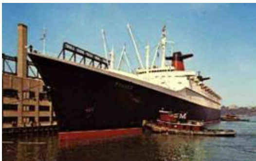
Foto S.S. France Foto Martin Cox collection uit www.maritimematters.com/norway.html

Op 11 mei 1960 liep te Saint-Nazaire op de Chantiers de l'Atlantique de pakketboot France van stapel. Met een lengte van 315,53 meter was de France destijds het langste passagiersschip ter wereld. Tegelijk was ze met een maximumsnelheid van 35,21 knopen de op één na snelste