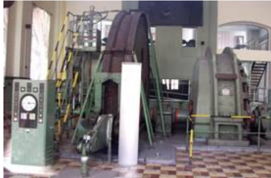
Foto A.B. Motoren liftkabels

Op 21 maart werd onder een stralende lentezon het Vlaams Mijnmuseum in Beringen bezocht door een groep SIWE-bestuurders en SIWE-leden. De introductie van het bezoek gebeurde bij een groot schaalmodel van de koolmijn van Beringen, opgesteld in het sociaal gebouw. De ongeveer 10 jaar oude audiovisuele presentatie heeft nog