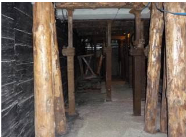
Foto.A.B. Opstelling van houten en metalen stutten voor galerijen en pijlers Foto genomen tijdens het bezoek van Siwe-leden aan het Vlaams Mijnmuseum te Beringen op 21 april 2009.

Redactieadres: SIWE vzw - Stapelhuisstraat 15 – 3000 Leuven. Tel.: 016.584342 e-mail: info@siwe.be Website: www.siwe.be Verschijnt tweemaandelijks. Verantwoordelijke uitgever: Patrick Viaene – Land van Waaslaan 156 – 9040 Gent. Redactie: Patrick Viaene, m.m.v. Bruno De Corte, Robin Engels en Karel Haustraete Eindredactie: het SIWE-team / Vormgeving: Alex Baerts Afgiftekantoor: 3360 Bierbeek – erkenningsnr.: P209286 – PB nummer: BC1608