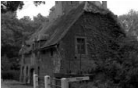
Rotemse molen.