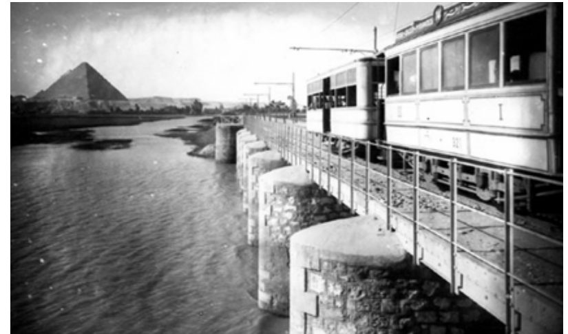
(vereniging in de kijker, zie volg. blz.)