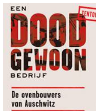
Figuur uit intro website

Joods Museum voor Verzet en deportatie een tentoonstelling over een weinig bekend aspect van de oorlogsindustrie, met name "Een doodgevoerd bedrijf. De ovenbouwers van Auschwitz".