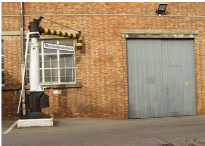
Ingangspoort Museumbewaarplaats

De Museumbewaarplaats ligt op 6 minuten lopen van het Station Leuven. Als je uit het station komt (zijde Leuven-centrum), wandel je naar rechts doorheen het busstation (langs de Diestse straat), 150 m verder naar rechts onder de spoorbrug. Na het viaduct onmiddellijk aan de overzijde van de (drukke) baan ligt uw bestemming (Brugbergenpad) dan zo'n 80m rechts omhoog! Enkel voor SIWE-leden en partner!