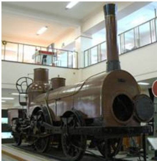
Stoomlocomotief Land van Waas, zie blz.2