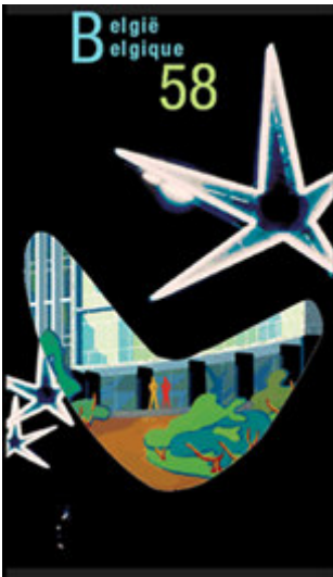
affiche uit vermelde website

Met zijn jeugdige toon, groot optimisme, vele felle kleuren en “scherpe” volumes die tradities van zich afschudden, verwerpt de “Atoomstijl” (of “58-stijl”) de vooroorlogse monumentale symmetrie. Dynamiek en technologie worden in de jaren vijftig hoog in het vaandel gevoerd, dit alles “in dienst van de mens en de wereldvrede”.