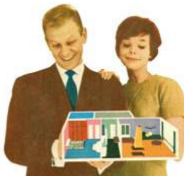
Tekening uit vermelde website