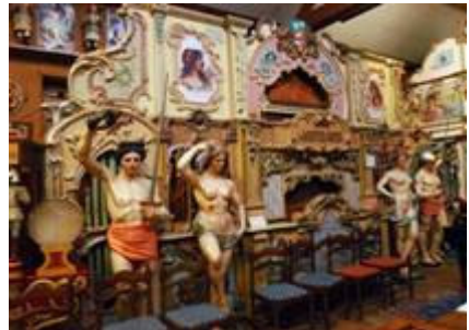
Foto Mortierorgel 1905 uit websiite