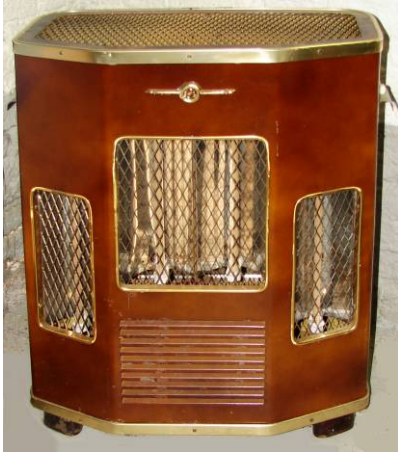
504.1 Verwarmingselement RFT Combinatie van ventilator en stralingselementen