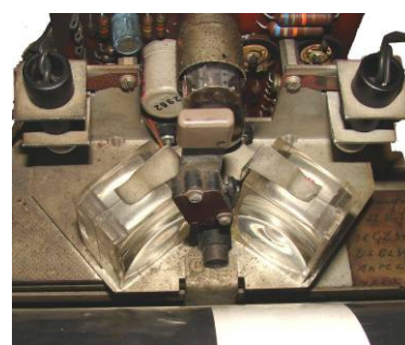
Leeskop (fotocel) met twee lampjes met lenzen op 45°