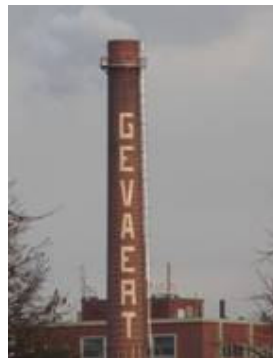
Schouw Gevaert Mortsel