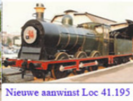
Nieuwe aanwinst Loc 41.195