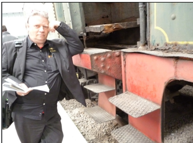
Foto Maldegem 4/5/2014 (A.B.) Geïnteresseerde luistert aandachtig naar de uitleg over de breedte van tender t.o.v. deze van de loc 41.195, de nieuwe aanwinst voor Maldegem

Op 3 & 4 mei 2014 vond het jaarlijks STOOMFESTIVAL plaats in het Stoomcentrum te Maldegem. Zes stoomlocs zorgden voor treinritten naar Eeklo: La Meuse 'Bebert' uit 1926, Avonside Fred (1925), de Poolse lok THh (uit 1959) alle drie uit eigen collectie, maar ook stoomloc Yvonne uit 1893 met MIVB-tramrijtuig uit 1891, gast-locs Magda (La Meuse, 1925) en Helena (Tubek, 1927)... Uniek is dat ook het onroerend erfgoed gevaloriseerd wordt: het "ontvangstgebouw", telegraafkantoor, goederenloods, woning van de stationschef, baanwachtershuis.